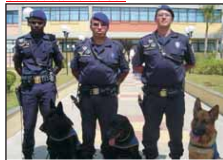
Guardas de São Caetano farão rondas com cães farejadores

A Prefeitura de São Caetano do Sul entregou o certificado de conclusão do curso de condutor para os dez guardas municipais que farão rondas nas ruas com cães farejadores. Os oficiais passaram por treinamento prático e teórico na Guarda Civil Metropolitana de São Paulo. A ação evitará pequenos furtos, em locais movimentados, e