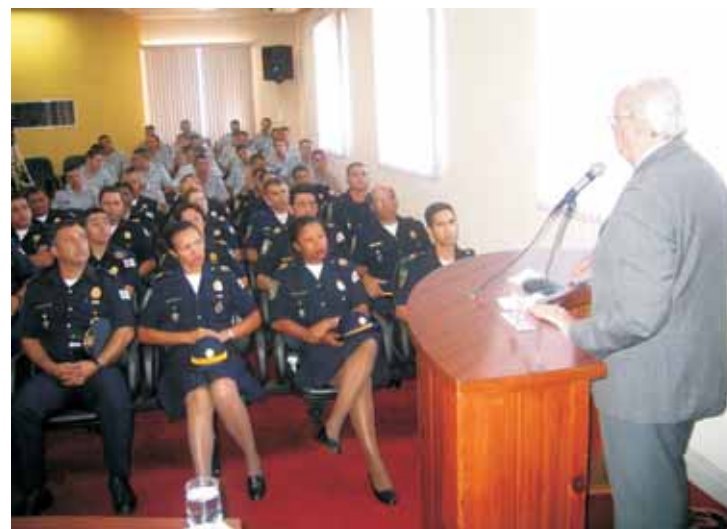
Ex-ministro da Justiça participou do encerramento do curso sobre Direitos Humanos

Buscando difundir os princípios de Direito Internacional dos Direitos Humanos e do Direito Internacional Humanitário e mantê-los presentes nas atitudes e comportamento do servidor da Guarda Civil Metropolitana, o Centro de Formação em Segurança Urbana promoveu no final de 2005 o primeiro Curso sobre Direito Humanos do Comitê Internacional da Cruz Vermelha. O evento é denominado "Integração dos Princípios de Direitos Huma-