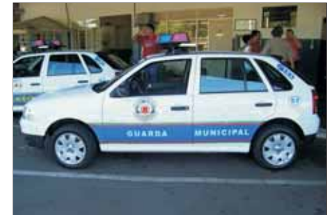
Nova viatura da Guarda Municipal de Americana