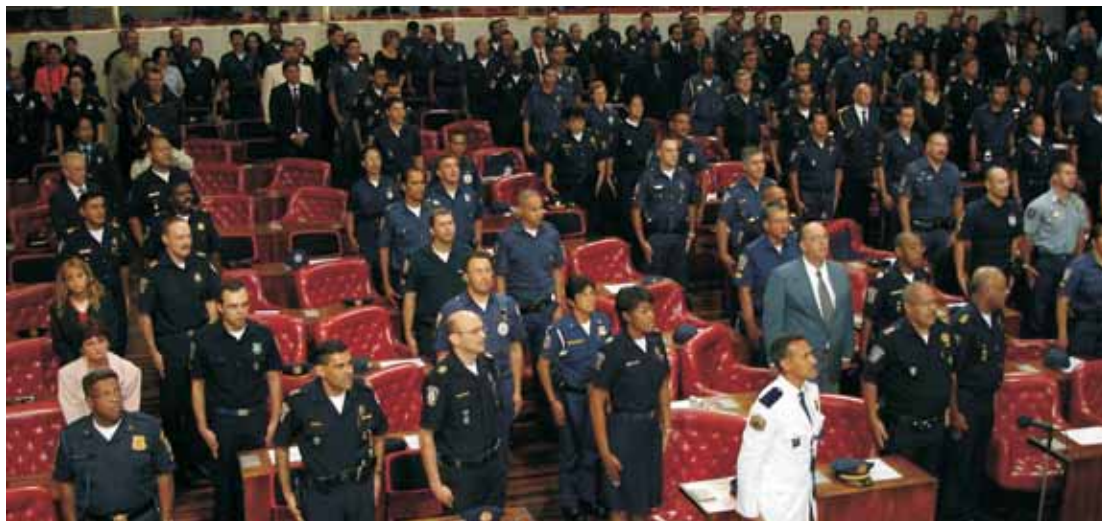
Solenidade em homenagem aos guardas municipais: AGMESP comemora 20 anos de fundação

A agenda de atividades programada pela diretoria da AGMESP será intensa e diversificada este ano, especialmente pela comemoração dos 20 anos de fundação da Associação no mês de julho. Além do lançamento deste jornal, que facilitará a divulgação dos trabalhos da AGMESP e das ações das Guardas Municipais do Estado de São Paulo, muitas novidades movimentarão os próximos meses. Reuniões, prêmios, palestras, campeonatos, entre outros eventos já estão agendados. Participe.