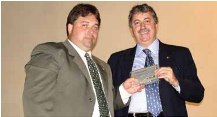
Deputado Sardelli tem trabalhado em favor das Guardas Municipais

O porte de arma de fogo para os guardas municipais gerou muita polêmica a partir da implantação do Estatuto do Desarmamento, em 2003. A lei 10.826 estabeleceu limites para o porte de armas dentro dessas instituições, tendo como referência o número de habitantes do município. O deputado Chico Sardelli (PV) discorda dessa vertente, pois entende que o crime não escolhe a cidade onde será praticado pela quantidade de seus habitantes. Para reverter essa situação, apresentou projeto de lei na Câmara Federal alterando a redação da lei 10.826/03 e autorizando o porte de arma de fogo aos