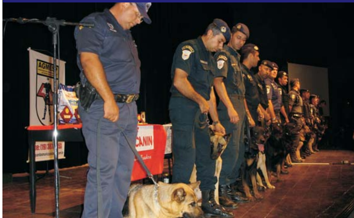
1º Congresso Brasileiro das Guardas Municipais realizado em julho: próxima edição acontecerá em Minas Gerais

O 2º Congresso Brasileiro das Guardas Municipais será realizado na cidade de Araxá, em Minas Gerais, no mês de julho, de acordo com a opinião dos próprios patrulheiros. Participaram da enquête promovida pela AGMESP e AGMBrasil 4.122 guardas municipais, sendo que 3.394 (82,4%) escolheram o município de Araxá para sediar o evento, outros 578 (14%) optaram por Florianópolis (Santa Catarina) e 150 (3,6%) votaram em Paulista (Pernambuco).